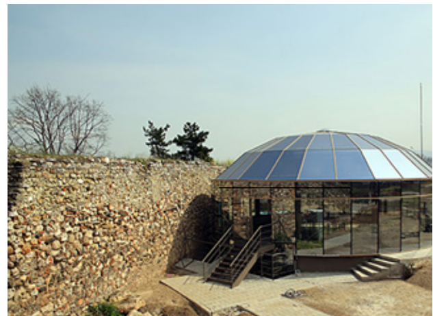
Fig.15. Museum of prehistory, Skopje kale (Fortress), Skopje, Macedonia (after E. Stojanova Kanzurova, 2015)

In Macedonia well known prehistoric complex is the Museum on Water, placed in the Bay of the Bones on Lake Ohrid. It is a pile-dwelling settlement, and it is a part of the National Institute for Protection of Cultural Monuments and the Museum Ohrid. The first phase of this project, financed by the Government of Macedonia was realized in 2008, same year when two of the dwellings in the Neolithic village, Skopje were built and promoted to the public. The Museum on Water in Ohrid, contains 24 dwellings