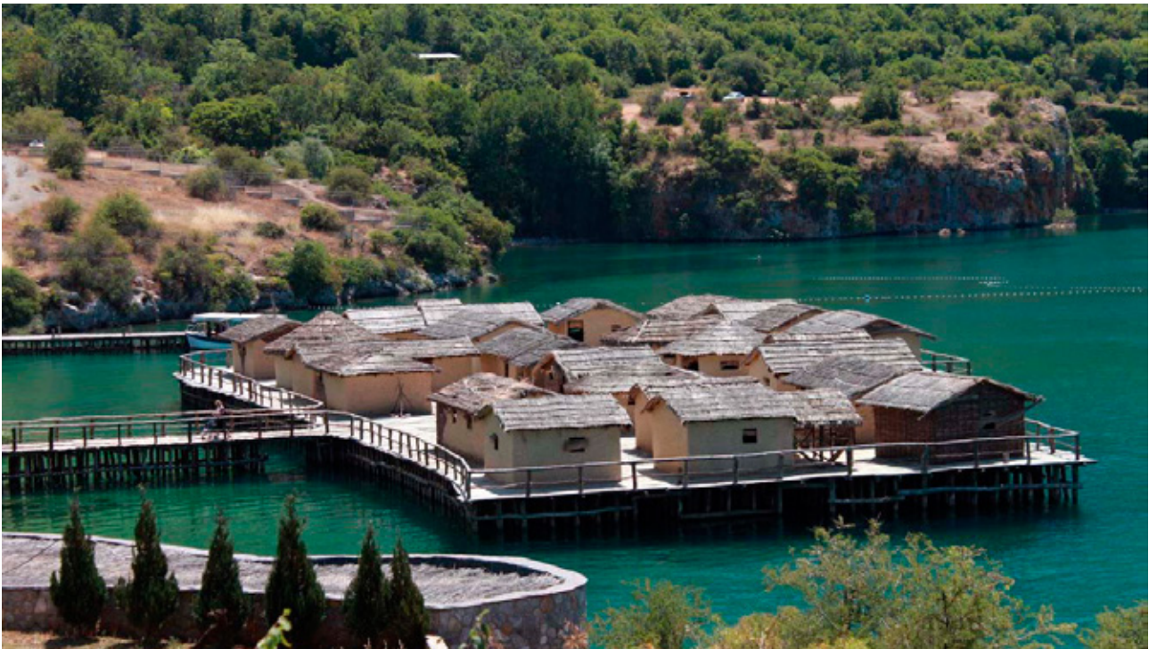
Fig.14. Museum on water, Bay of the bones, Lake Ohrid, Macedonia (after E. Stojanova Kanzurova, 2016)