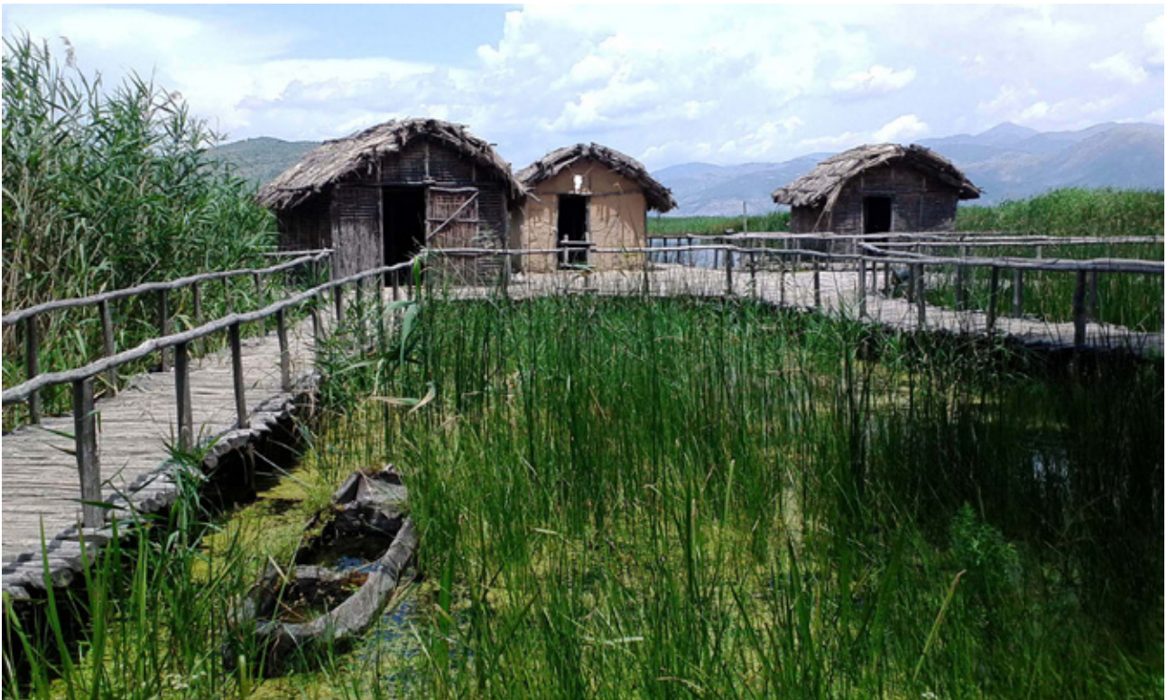
Fig.12. Archaeological open-air museum, Dispilo (Dupljak), Lake Kostur (Kastoria), Greece (after E. Stojanova Kanzurova, 2016)