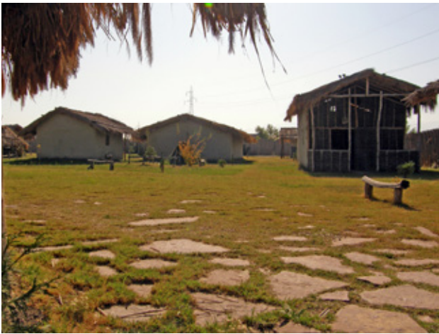
Fig.1. Part of the Neolithic village, Skopje, Macedonia (after E. Stojanova Kanzurova, 2012)