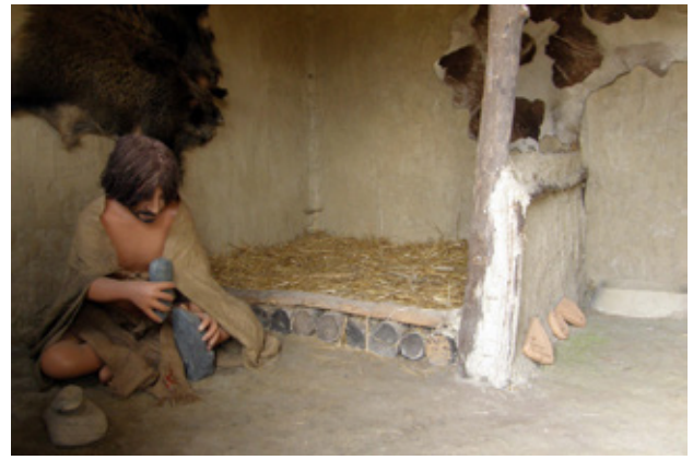
Fig.8. Internal space on the house 4, Neolithic village, Skopje, Macedonia (after E. Stojanova Kanzurova, 2012)