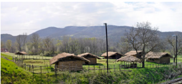
Fig.13. Arheopark Pločnik, Prokuplje, Serbia (after http://pločnik.org.rs/ )

associated with the Middle and Late Neolithic period (dating back to the middle of the 6 millennium BC).