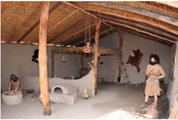
Fig.4. Internal space on the house 1, Neolithic village, Skopje, Macedonia (after E. Stojanova Kanzurova, 2012)