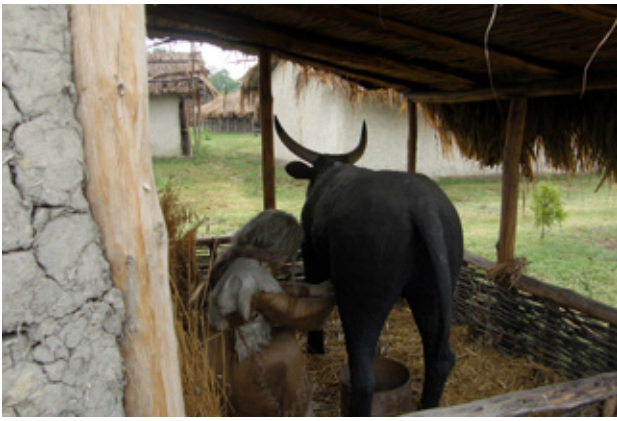
Fig.7. Animal figures in the Neolithic village, Skopje, Macedonia (after E. Stojanova Kanzurova, 2012)