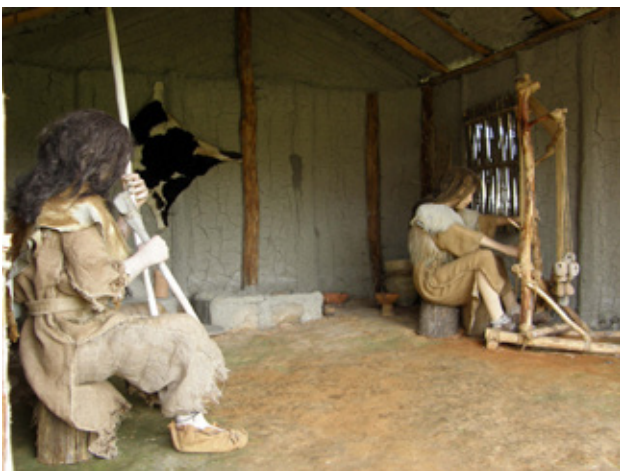
Fig.5. Internal space on the house 2, Neolithic village, Skopje, Macedonia (after E. Stojanova Kanzurova, 2012)

architectural facilities are built of natural materials, such as: wood, earth, straw and reeds. Because of the maintains of the facilities on some parts of the houses, contemporary building material was used. Inside of the houses copies of the archaeological findings excavated on this site are displayed, supplemented with household inventory like ovens, fireplaces, storage bins and sleeping platforms (fig.6). Also, models of human mannequins are placed inside the houses, integrated into variety of everyday scenes from the time of the Neolithic period such as pottery making, weaving, grinding grains, making stone tools etc (fig.4, 5, 8). Outside the houses in the free area around the museum smaller facilities are positioned where models of animal figures 8 are placed depicting the everyday atmosphere of our ancestors (fig.7). All of this is made with a purpose to attract the visitors, especially the younger population, and to get them