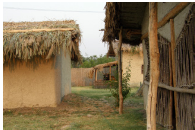
Fig.3. Part of the Neolithic village, Skopje, Macedonia (after E. Stojanova Kanzurova, 2012)

The construction of the archaeological open-air museum was placed in the western area of the archaeological site Tumba, Madzari where no cultural layers were discovered. Additional requirements for the preparation of the construction site were requested as well. These additional requirements were: dislocation of the huge urban waste which for years has been deposited at the archaeological site, road communications to the site, parking place, partial fencing of the site,