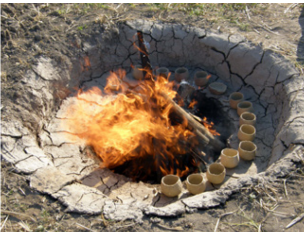
Fig.9. Experimental archaeology, pit firing pottery, Neolithic village, Skopje, Macedonia (after E. Stojanova Kanzurova, 2012)