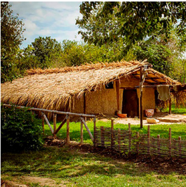
Fig.11. Archaeological open-air museum, Neofit Rilski village, Varna, Bulgaria (after http://antiquevillage.eu/bg/Neolithic/Basic/ )