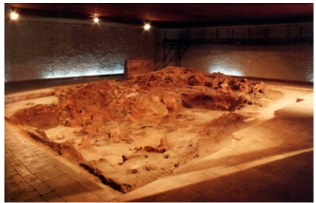
Fig.10. Neolithic Dwellings Museum, Stara Zagora, Bulgaria (after Tstvetan Chetashki)

on Archaeological Research and Communication) in 2010 the archaeological site Tumba, Madzari and the Neolithic village, became a member of this prominent international organization. EXARC is a European organization of archaeological open - air museums and experimental archaeology formed as a part of ICOM. The main goal of this organization is to establish high standards in both scientific fields of archaeological reconstruction and experimental archaeology and presentation through constant exchange of knowledge, human resources, and publications 10 Nowadays this organization counts members of many museum institutions and individuals from over 40 countries.