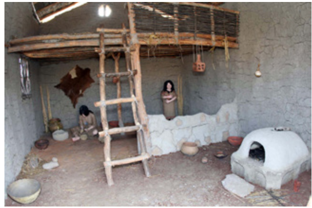
Fig.6. Internal space on the house 3, Neolithic village, Skopje, Macedonia (after E. Stojanova Kanzurova, 2012)