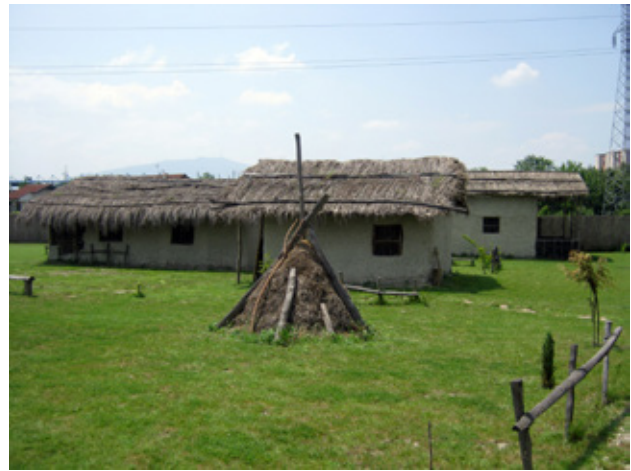
Fig.2. Part of the Neolithic village, Skopje, Macedonia (after E. Stojanova Kanzurova, 2012)

ceramic art as a national cultural brand and nominate them for UNESCO's world material cultural heritage.